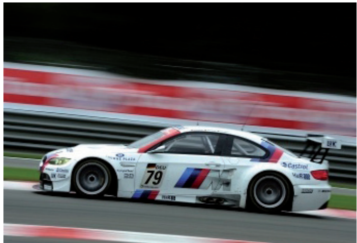
Die Ärzte arbeiten unter anderem für das Team BMW-Motorsport.